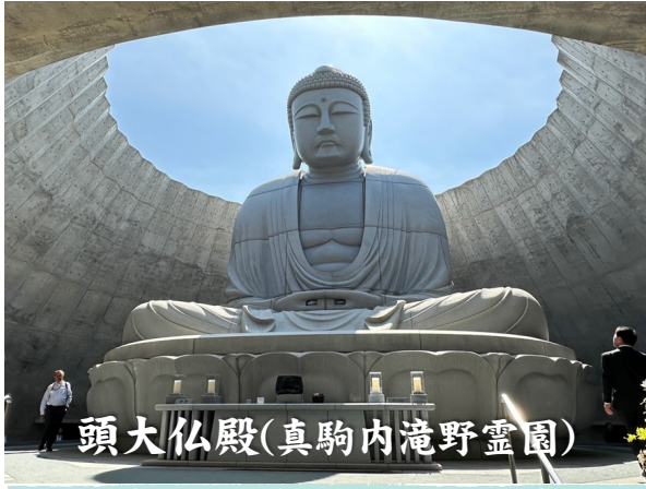
頭大仏殿(真駒内滝野霊園)

夏本番を迎え、暑さの厳しい季節になりました。いかがお過ごしでしょうか？ さて、先月20日に所属している日本石材産業協会の年次総会に出席しました。今回は札幌開催で、人生2度目の北海道！天気にも恵まれ、北海道最大の真駒内滝野霊園などを見学。全国の石材店の皆さん